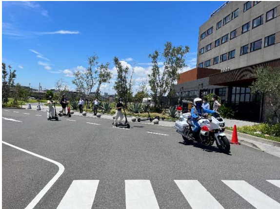
2022年7月28日 川崎キングスカイフロント安全講習会(川崎市川崎区)