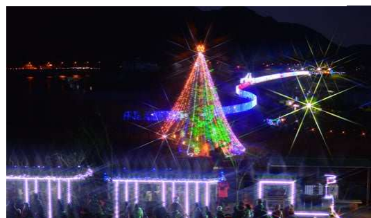
宮ヶ瀬湖畔園地 クリスマスツリー